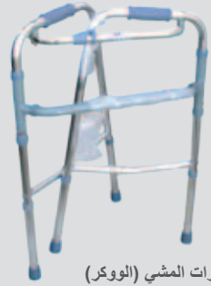
إطارات المشي (الووكر)