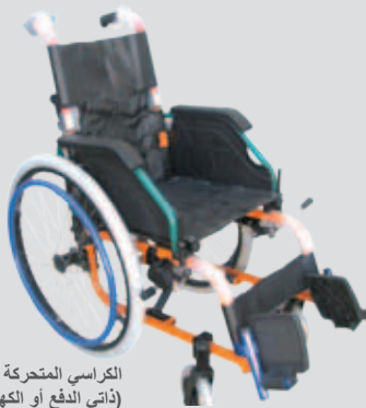
الكراسي المتحركة (ذاتي الدفع أو الكهربائي)